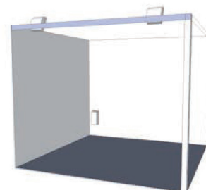
2 lato aperto

Eventuali variazioni all'allestimento standard devono essere comunicate all'organizzatore